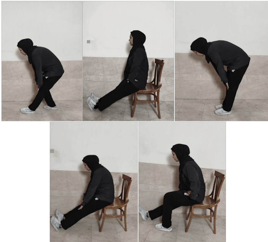
شکل ۱. تمرینات کششی

نکته شایان توجه آن است که اگر زاویه مفصل بیش از ۸۰ درجه باشد، افزایش طول همسترینگ را نشان می دهد و در صورتی که تیلت خلفی بیش از ۱۰ درجه باشد و ران در حدود ۸۰ درجه بالا برده شود، بیانگر کاهش طول همسترینگ ها است؛ به همین علت برای جلوگیری از تیلت خلفی و فلکشن کمری بیش از حد، ثابت نگه داشتن لگن در حالت صاف بودن کمر (با محکم نگه داشتن پای مقابل روی تخت) ضرورت دارد. در صورت کوتاه بودن طول عضلات همسترینگ، زاویه ای که ران با تخت می سازد کمتر از ۸۰ درجه است؛ پس اگر زاویه SLR همچنان ۸۰ درجه باشد ولی کمر هایپرلوردوزیس (گودی کمر افزایش یافته) داشته باشد، این مسئله بیانگر افزایش طول همسترینگ ها است (۱۰،۲۰). استفاده از گونیامتر Sammons Preston برای اندازه گیری دامنه حرکتی زاویه مفصل ران در آزمون SLR برای تعیین کوتاهی عضله همسترینگ با دقت ۰/۹۸ درصد برآورد شد؛ از سویی دیگر، در اندازه گیری قدرت ایزومتریک در اندام تحتانی، میزان اعتبار و روایی